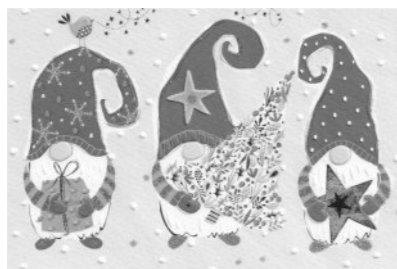
Daxi, Hella und Hilke

Da wollen wir's mal wieder ordentlich krachen lassen!